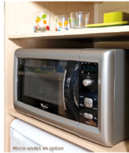
Micro-ondes en option